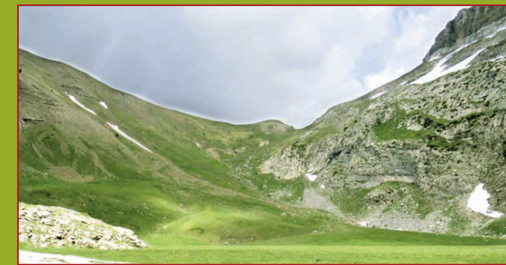
Collado del Bozo desde la planicie del ibón de Izagra

El SL-HU 105 "Ruta del Puerto de Aisa" es un recorrido circular que permite descubrir la zona de alta montaña del puerto de Aisa, en la cabecera del río Estarrún, un espacio de praderas alpinas situado bajo los emblemáticos picos de Liena del Bozo, Liena de la Garganta y Aspe, y que está delimitado también por los collados del Bozo y de Rigüelo. Se compartimenta, además, en dos valles de origen glaciar: el de Igüer y el de Rigüelo.