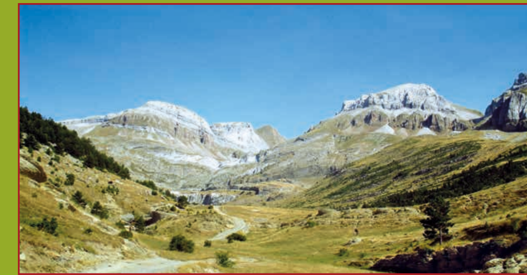
Valle de Igüer