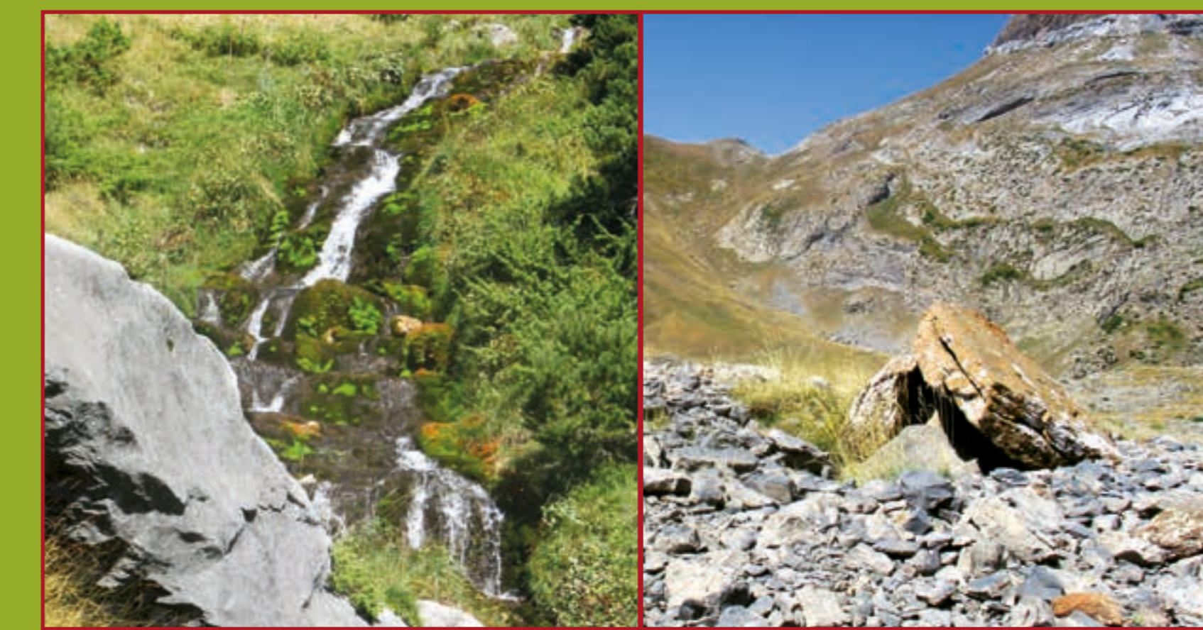
Surgencia "El Chorrotal"