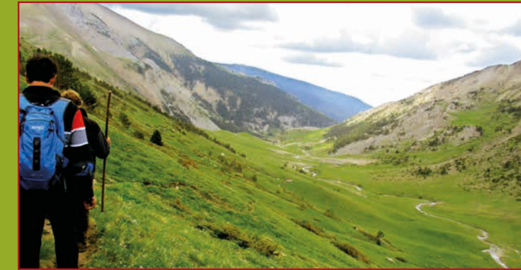
Valle de Igüer desde la ruta (tramo compartido con el GR 11.1)